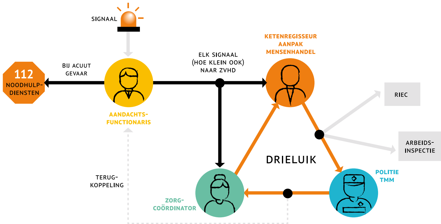
FIGUUR 1. MELDINGSROUTE SIGNALEN MENSENHANDEL DRENTHE

Signalen van mensenhandel komen onder meer terecht bij gemeenten in Drenthe, de Koninklijke Marechaussee (KMar), de Opsporingsdienst van de Nederlandse Arbeidsinspectie, Team Migratiecriminaliteit Mensenhandel (TMM,) van de politie, het RIEC Noord-Nederland, het Zorg- en Veiligheids-huis en bij zorgorganisaties en de vluchtelingenketen. Steeds meer (lokale) organisaties binnen de mensenhandelketen hebben een of meerdere aan-